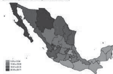
Tasa de mortalidad por cáncer de mama en mujeres de 20 años o más por entidad federativa 2018 (Defunciones por cada 100 mil mujeres de 20 años o más)

Nota: Se utilizó la Clasificación Estadística Internacional de Enfermedades y Problemas Relacionados con la Salud (CIE-10), código C50 (Tumor maligno de la mama).